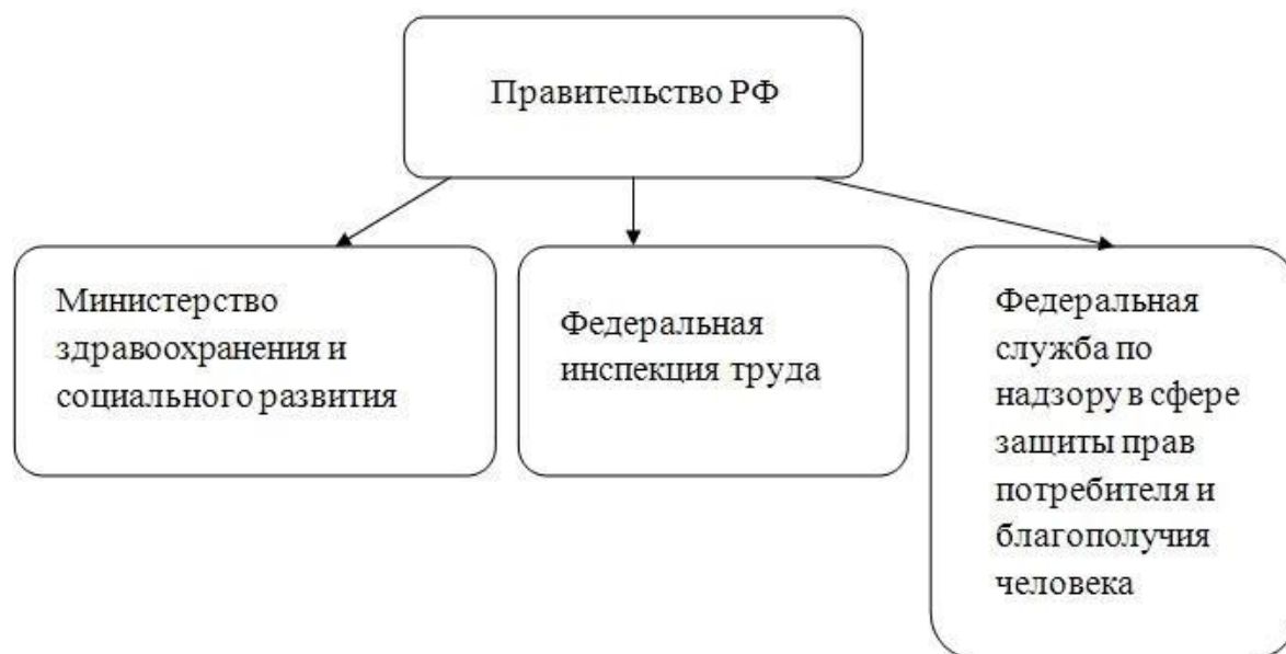
Рис. 3 – Иерархия государственного регулирования охраны труда

Сфера охраны труда граждан является одной из самых важных в трудовых взаимоотношениях, поэтому государство её чётко регулирует с помощью своих органов власти. Иерархия государственного регулирования представлена на рис. 3.